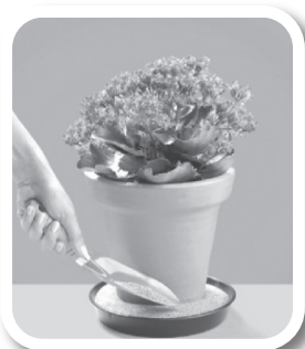
Coloque areia no pratinho dos vasos de plantas