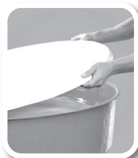
Tampe caixas d'água