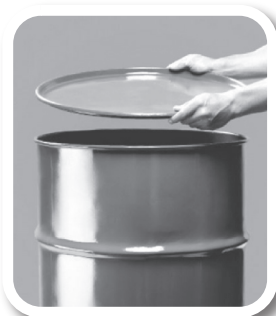
Feche bem tonéis e barris

Defenda sua família, seus vizinhos, sua comunidade. Não basta combater o mosquito. Precisamos eliminar seus criadouros e qualquer local ou recipiente que acumule água parada.