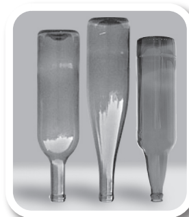
Esvazie e guarde garrafas sem uso de cabeça para baixo

AGÊNCIA BRASIL CENTRAL abc GOVERNO DE GOIÁS