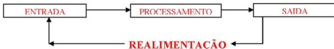
Figura 1: Etapas de um processamento de dados.

Em informática, e mais especialmente em computadores, a organização básica de um sistema será na forma de: