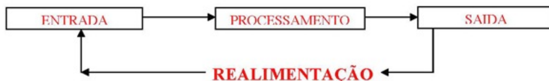
Figura 1: Etapas de um processamento de dados.

Em informática, e mais especialmente em computadores, a organização básica de um sistema será na forma de: