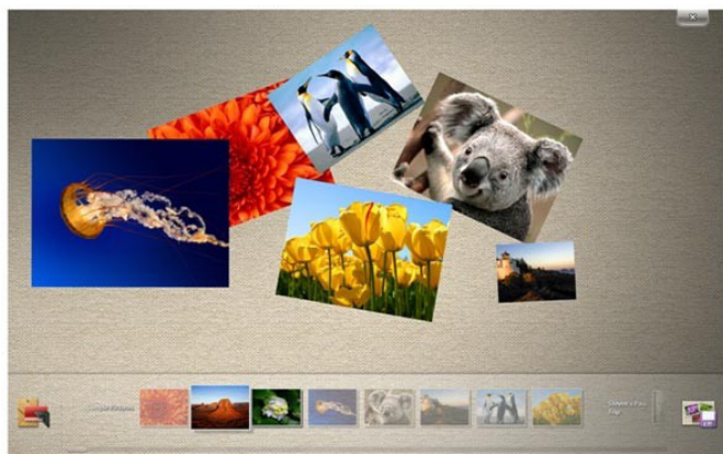
Microsoft Surface Collage, desenvolvido para usar tela sensível ao toque.

O Touch Pack para Windows 7 é um conjunto de aplicativos e jogos para telas sensíveis ao toque. O Surface Collage é um aplicativo para organizar e redimensionar fotos. Nele é possível montar slide show de fotos e criar papéis de parede personalizados. Essas funções não são novidades, mas por serem feitas para usar uma tela sensível a múltiplos toques as tornam novidades.