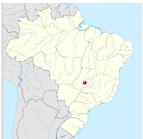
Localização de Guapó no Brasil