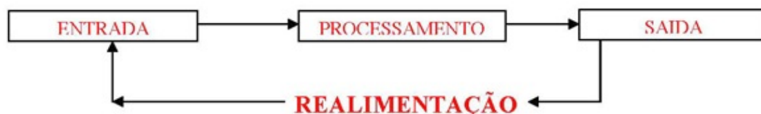
Figura 1: Etapas de um processamento de dados.

Em informática, e mais especialmente em computadores, a organização básica de um sistema será na forma de: