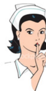
Imagem indicativa de "silêncio".

Símbolo que se coloca na porta para indicar "sanitário masculino".